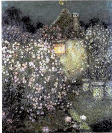
(上) The House with Roses (1936) まさに、外壁をバラの花で飾った家。 ル・シダネールが愛した光景なのだろう (左下) 離れ屋 (Le pavillon/1932) 急傾斜の屋根の煙突が、ジェルプロワの建物を思い起こさせる。ひろしま美術館蔵