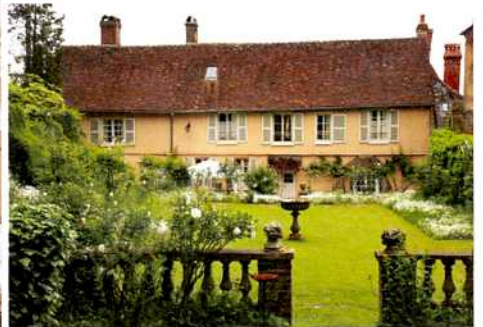
(上) アンリ・ル・シダネールの住んだ家。 現在は孫が週末を過ごす家として使っている (左) ル・シダネールのアトリエ。 当時のまま保存されている。4/1から公開予定 (公開期間は4~10月)、要予約 ☎03・44・46・32・20 (団体15~60名) ☎03・44・82・36・63 (個人)